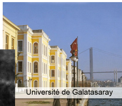
Université de Galatasaray