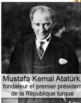
Mustafa Kemal Atatürk, fondateur et premier président de la République turque

- Après le 16 juin et en cas de no-show : 100% du montant du voyage